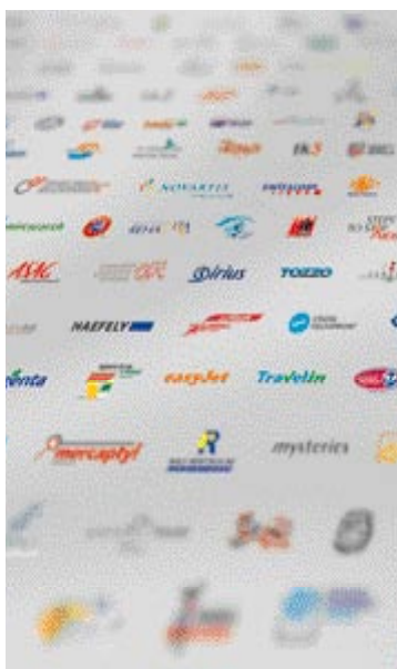
Unternehmensmarken: kostbare Assets in Krisenzeiten

Tagtäglich werden wir mit neuen Meldungen konfrontiert, welche die viel zitierte Krise von allen Seiten beleuchten, analysieren, prognostizieren und leider nur zu selten relativieren. Dass es nachweislich in zahlreichen Branchen und Industriezweigen nicht gerade rosig aussieht, lässt sich nicht von der Hand weisen. Doch ob die eigenen Aktiedepots, die Marktsegmente, die Absatzvolumen oder die Umsatzzahlen als halb leer oder halb voll gesehen werden, entscheidet jeder von uns selbst. Wer als Unternehmer oder als Markenverantwortlicher hier die positive Betrachtungsweise wählt, verschafft sich beste Chancen, erfolgreich durch diesen Krisensturm zu segeln.